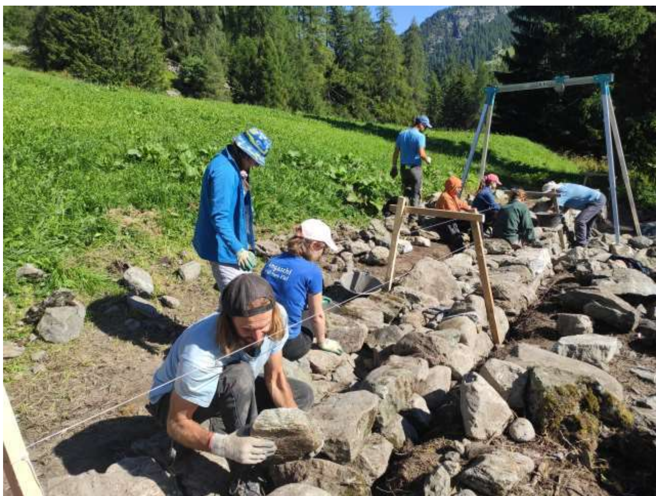
Nature Parc Ela - Reconstruction of dry stone walls (Savognin GR), Workcamp 2023

Service Civil International (SCI) Schweiz nach Swiss GAAP FER 21