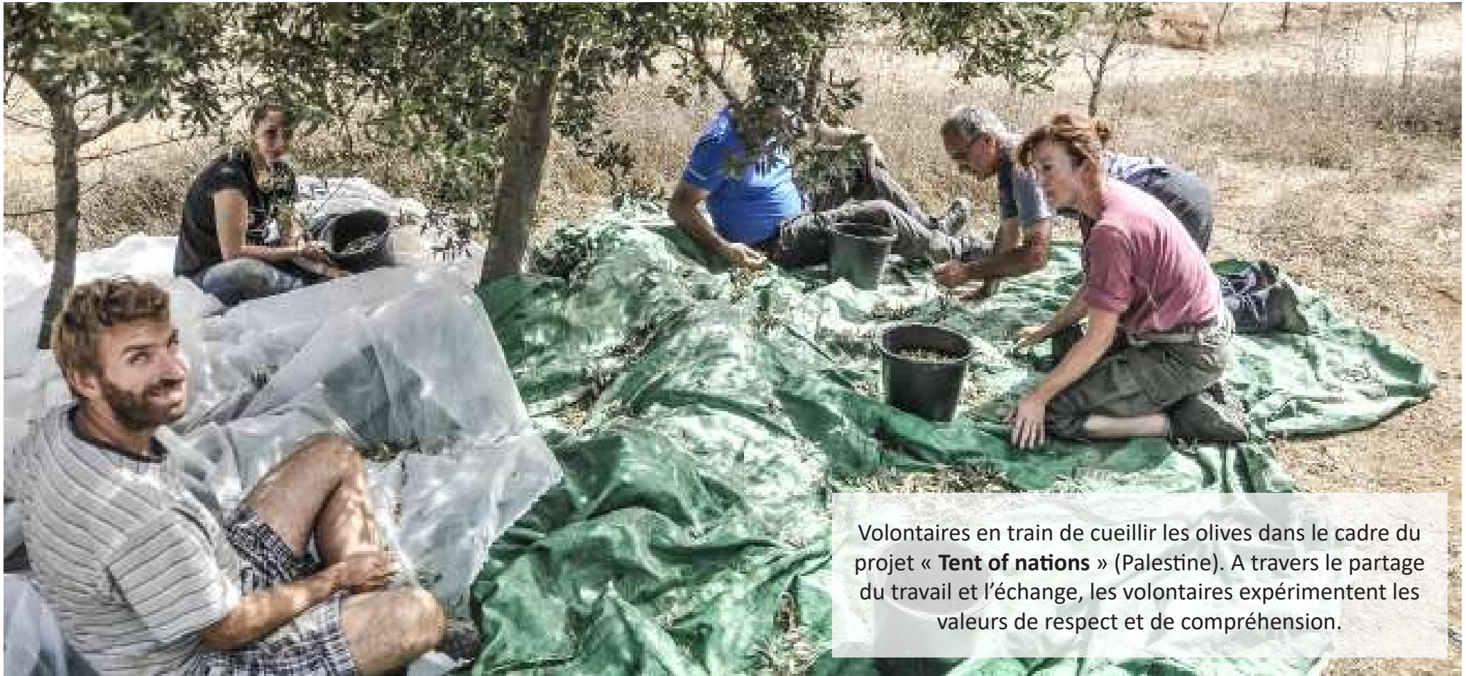
Volontaires en train de cueillir les olives dans le cadre du projet « Tent of nations » (Palestine). A travers le partage du travail et l'échange, les volontaires expérimentent les valeurs de respect et de compréhension.