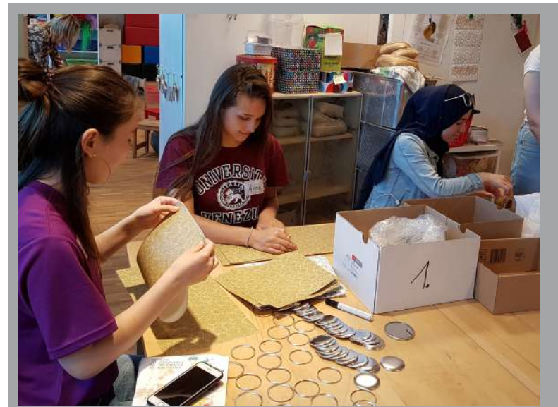
Chantier « FêteKulturel », Maison des Religions, Berne (été 2019)

Dans votre testament, vous pouvez verser au SCI en tant qu'héritier un pourcentage de votre succession , donc de vos avoirs (et de vos dettes éventuelles).