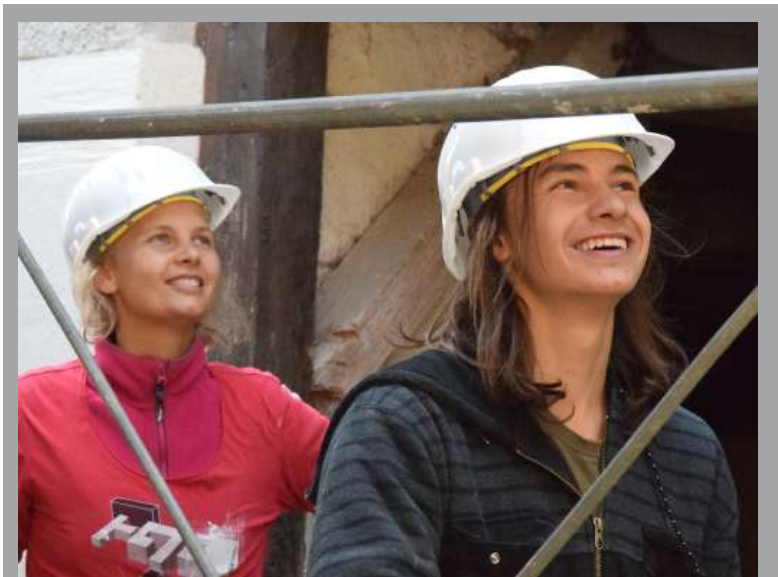
Chantier « Animal Sanctuary Renovation Works » à Kleinlutzel SO (juillet 2019)

A travers un legs ou une donation, vous pouvez favoriser le SCI Suisse sans en faire un héritier. Cela signifie que vous le mentionnez dans le testament avec un montant fixe (en CHF) ou un ou plusieurs objets désignés avec précision (p. ex. un bijou, un tableau ou un bien immobilier).