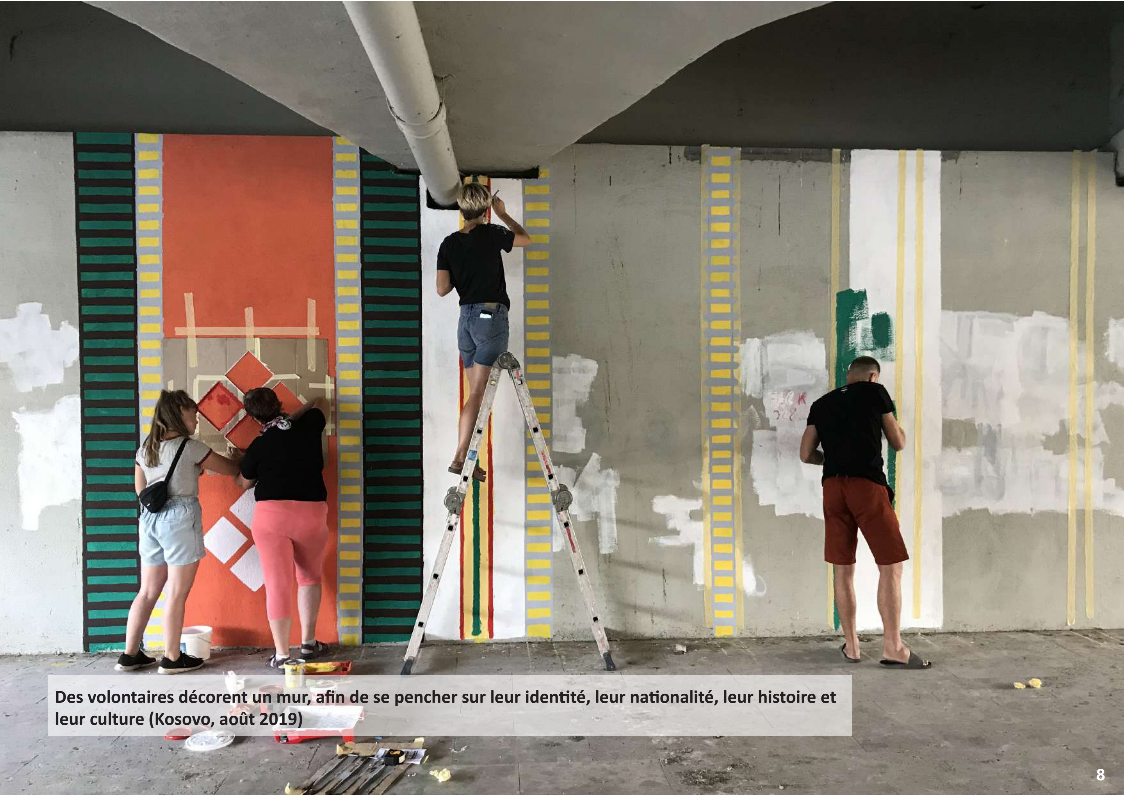
Des volontaires décorent un mur, afin de se pencher sur leur identité, leur nationalité, leur histoire et leur culture (Kosovo, août 2019)