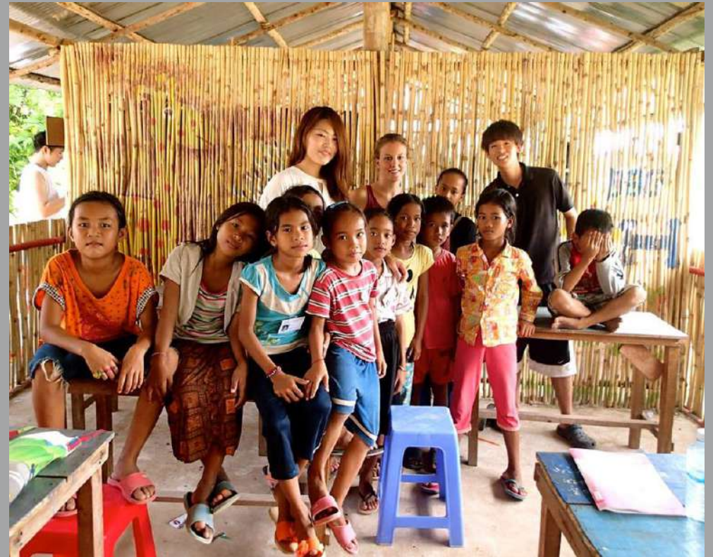
Chantier « Chea Smon School » (Cambodge) : les volontaires enseignent aux enfants de l'école primaire l'anglais, la musique, l'art et le sport, et organisent des événements et des ateliers sur la santé, l'égalité et l'environnement.